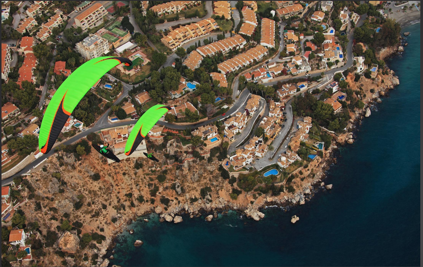
Deux Icepeak 7 en balade au-dessus de la Méditerranée