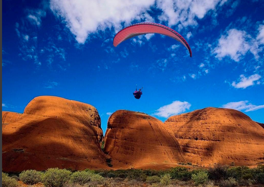
L'Alpine, une voile Trekking de 2005, homologuée CEN Standard.