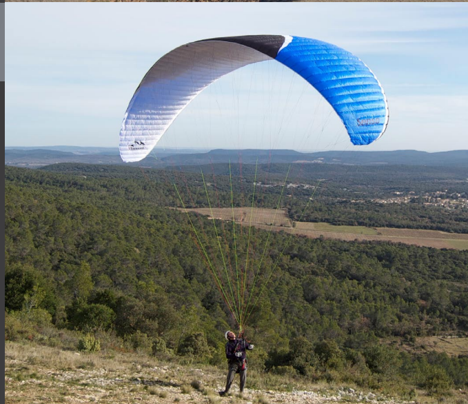
La Senso est la première voile de la "nouvelle" marque Trekking. Elle est homologuée EN B et affichée à 1990 euros.