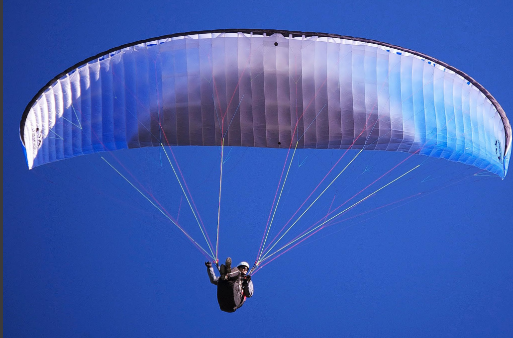
Selon le fabriquant, le tissu de la Senso est du 100 % Porcher.

Selon Trekking, une production européenne ne doit même pas être plus chère : le surcoût par rapport à une fabrication en Asie deviendrait de moins en moins important, étant donné que les frais de transport augmentent tout comme la main-d'œuvre asiatique. Selon Nicolas Brenneur, dans quelques années, même une production 100 % en France pourrait redevenir compétitive.