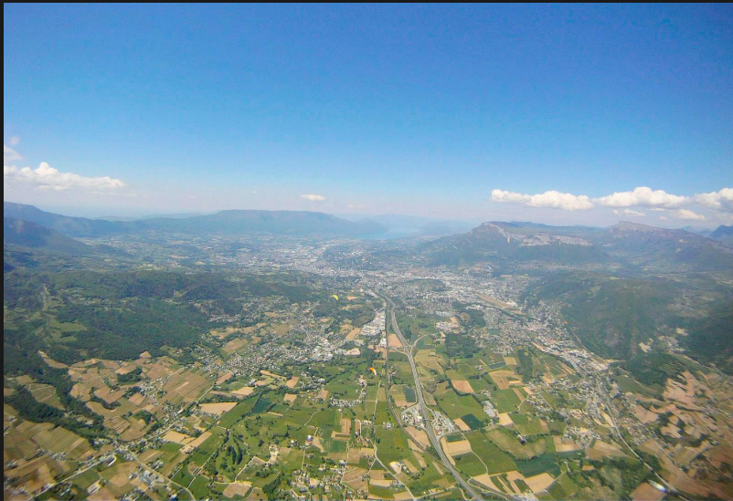
Transition Granier - Montgelas (Chambery)