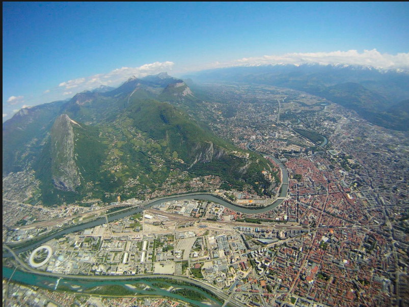
Transition Moucherotte - Le Rachais (Grenoble)