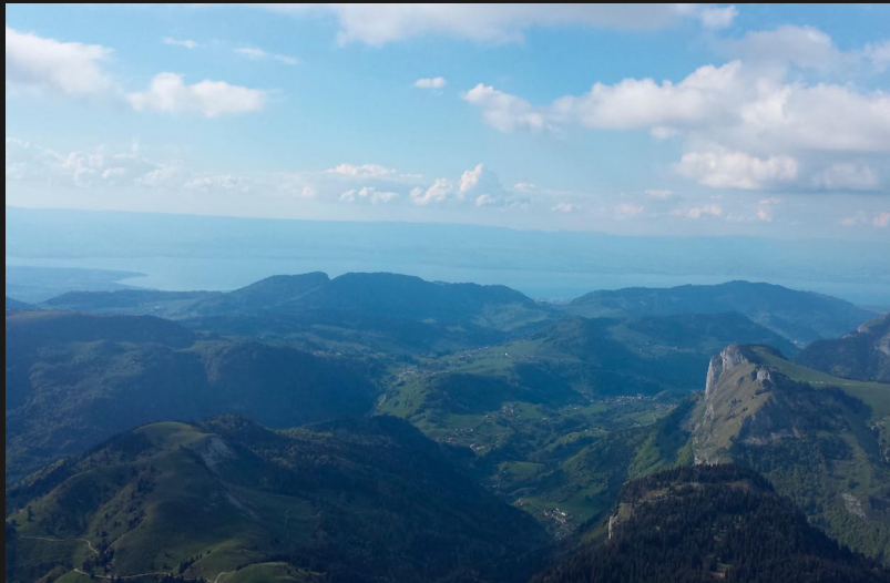
Pointes des Folllys (Lac Léman)