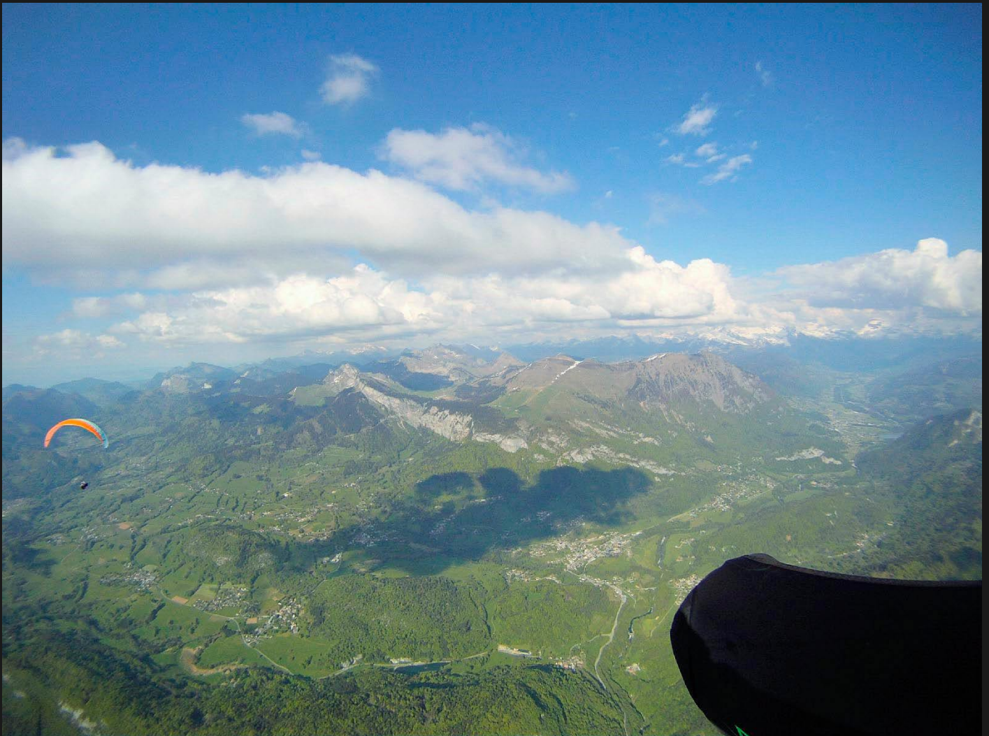
Transition Pointe d'Andey - Le Môle (Mieussy)