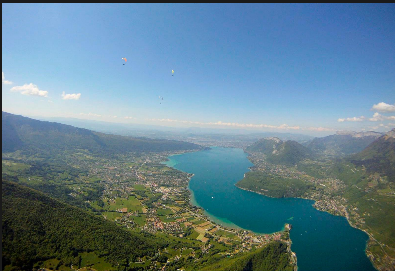
Transition Roc des Bœufs