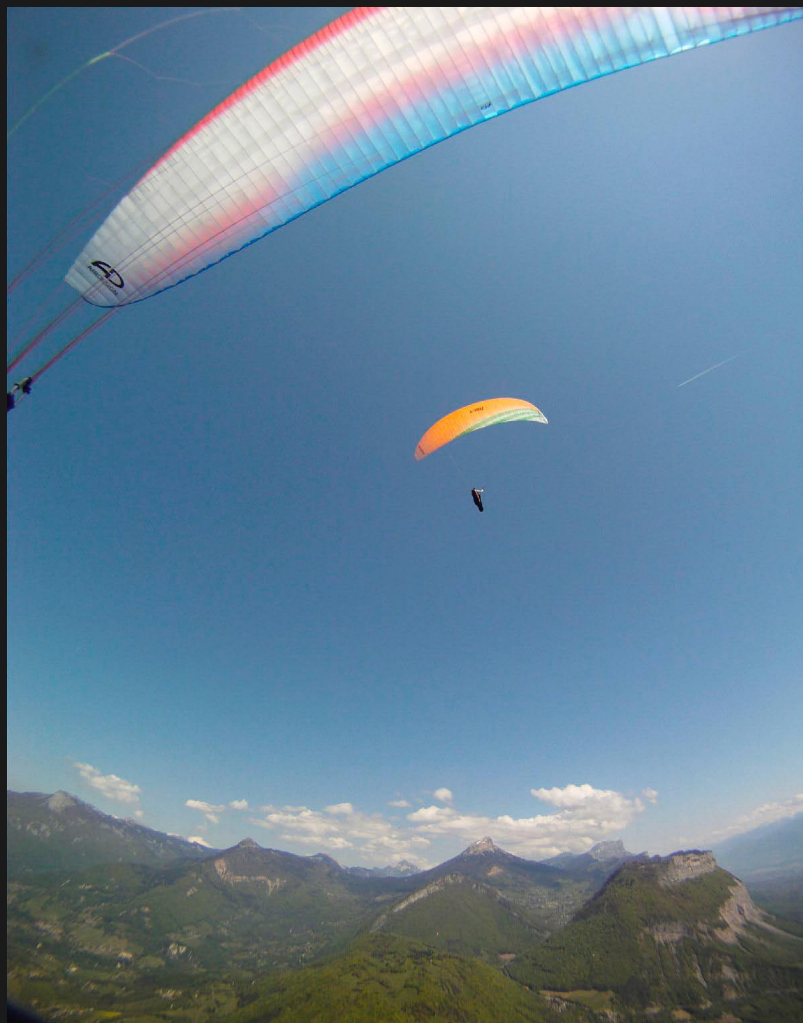
Arrivée au Rachais.

les amoureux du Vercors. Météo du jour : Flux de sud 15 km/h en baisse sur le Nord, Cumulus, thermiques généreux, étalements dans les massifs sur le soir, plaf. max : 2 700 m