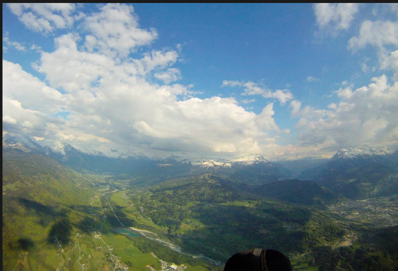
Agy et Samoens

Le téléphone commence à sonner dans la poche, les potes au sol sont avec nous, la radio jacasse, tout le monde commence à changer de comportement, tantôt euphorique, tantôt irritable ou presque, bref on se marre bien.